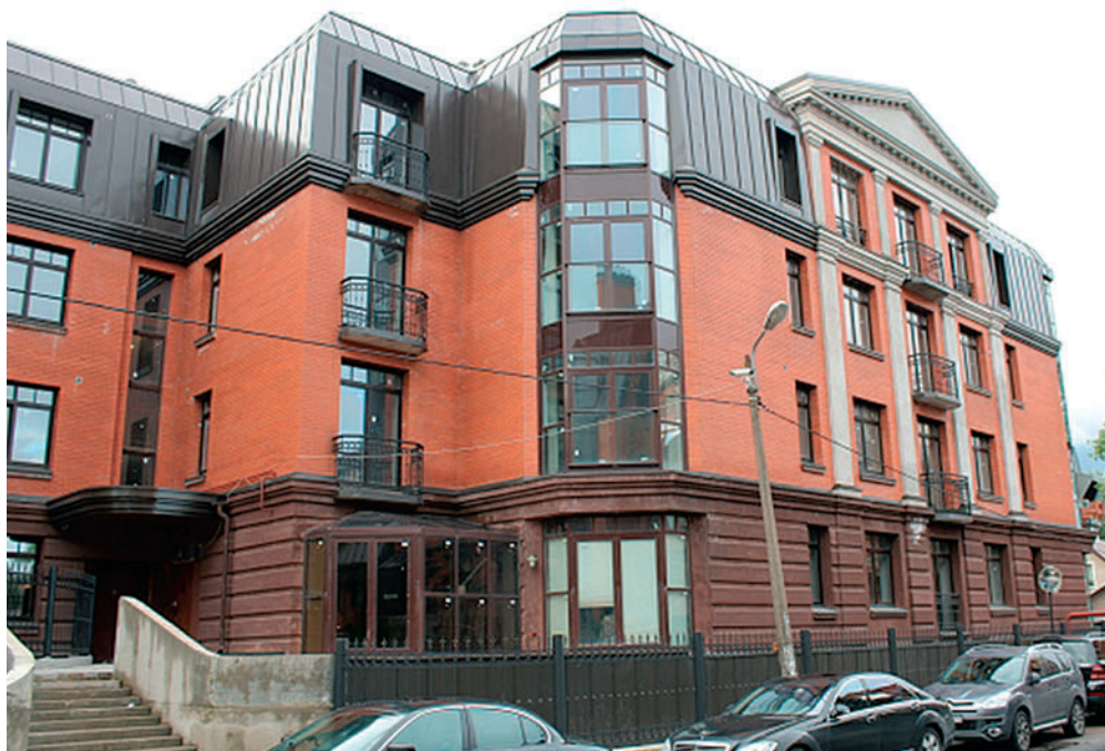
Никитинская усадьба на ул. Горной, 22: по решению суда объект требуют снести

Правильно поставленная работа нового органа, основанная на единой методике рассмотрения ситуаций с самовольно построенными объектами, поможет сбалансированно и разумно решить поставленные задачи, снять социальную напряженность в обществе, и позволит, наконец, навести порядок в городской застройке.